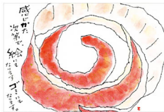
菅川清子(埼玉) 暮らしを丁寧にと心がけていると、一つ ひとつ見えてくるものがあります。