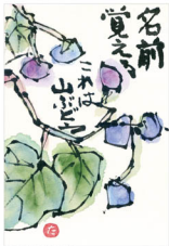
眞井剛子(64歳・香川) 知らなかった名前を覚えてもらったり、 調べたりして覚えるのが楽しい。