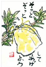
打浪幸恵(66歳・岡山) 我が家の庭で、よく見るとキタキ チョウが枝にとまっていました。