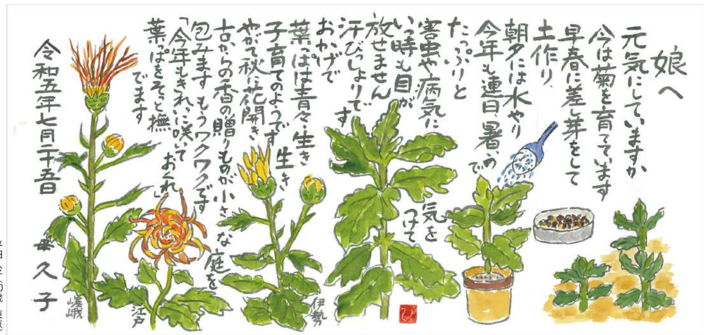
平田久子(80歳・東京) 1年に2回くらいしか 会えない娘へ近況を。