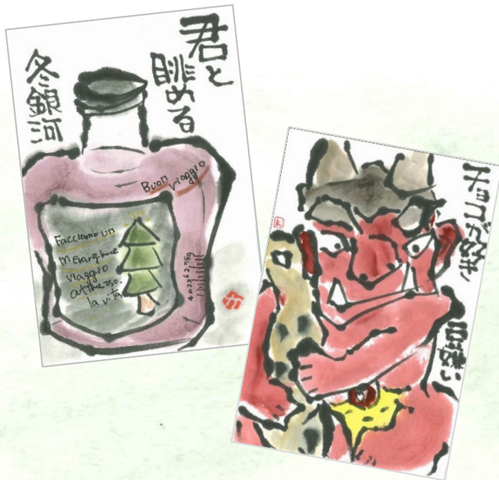
(彩美墨を使った講師の絵手紙)

彩美墨は、吉祥の高品質顔料と奈良・古梅園製の高級油煙墨(紅花墨)を練り合わせて作られた墨感のある顔彩です。濃くすると墨感が強く、中間は墨に含まれる膠の効果で艶のある色に、薄めると顔彩色が強く出ます。ほんのり墨の薫りがします。