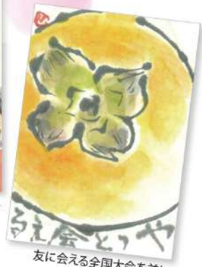
いつも元気をくれる 22歳離れた友だち