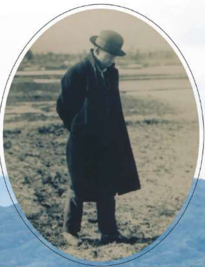
羅須地人協会設立の頃の賢治 1926年(大正15)春