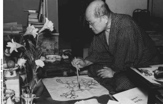
小池邦夫が実篤 昭和30年代 調布市武者小路実篤記念館蔵

むかしやこういざねあつ 1893年(明治16)～1976年(昭和51)、享年83。 東京都千代田区生まれ。小説家。1910年、志賀直哉 らと雑誌「白樺」を創刊。1918年宮崎虎造に「新しき村」 を解説。40歳頃から漫画の制作をはじめた。