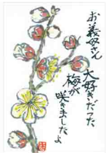
桂 正子(徳島) 私が古いセーターを編み直したり、残り布でブワウスを縫ってあげたりすると「女(おなご)の手は空じゃ、ありがとよ」と言って大家喜んでくれました。